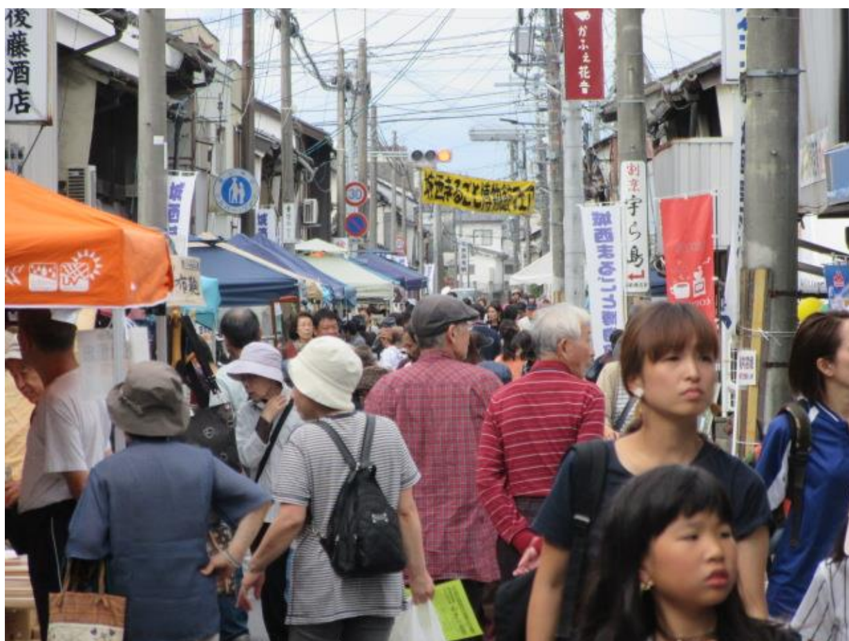
「津山・城西まるごと博物館フェア2018」