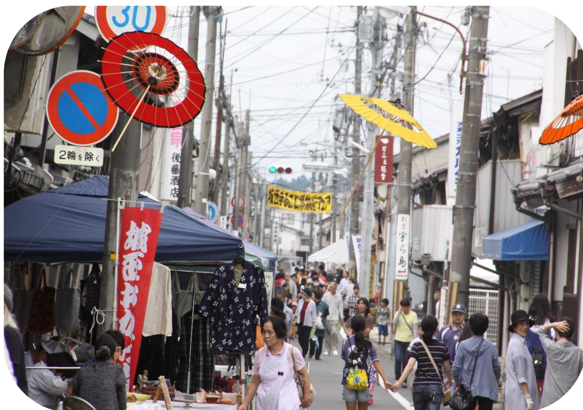
「津山・城西まるごと博物館フェア 2016」